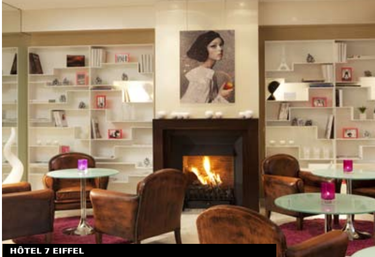
HÔTEL 7 EIFFEL