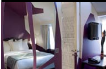
HÔTEL CRISTAL CHAMPS-ÉLYSÉES