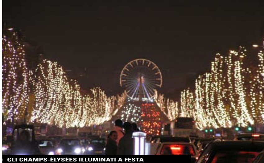
GLI CHAMPS-ÉLYSÉES ILLUMINATI A FESTA