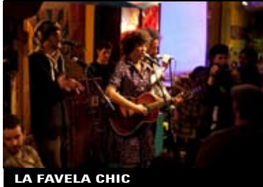
LA FAVELA CHIC