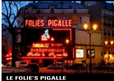
LE FOLIE'S PIGALLE