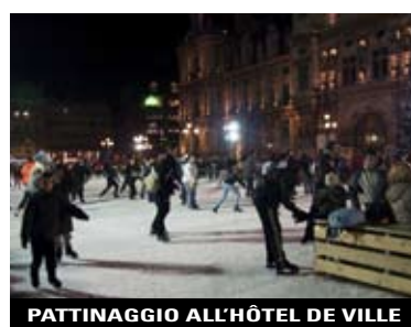
PATTINAGGIO ALL'HÔTEL DE VILLE