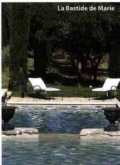
La Bastide de Marie